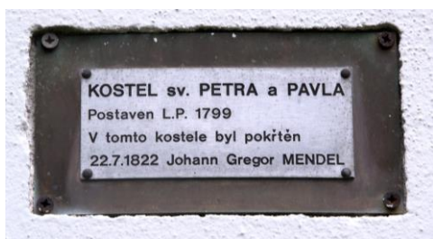
Pamětní deska na kostele