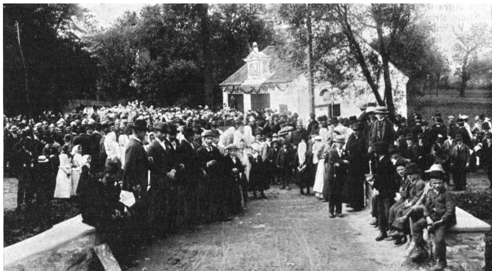
Odhalení pamětní desky na hasičské stanici v Hynčicích 20. července 1902