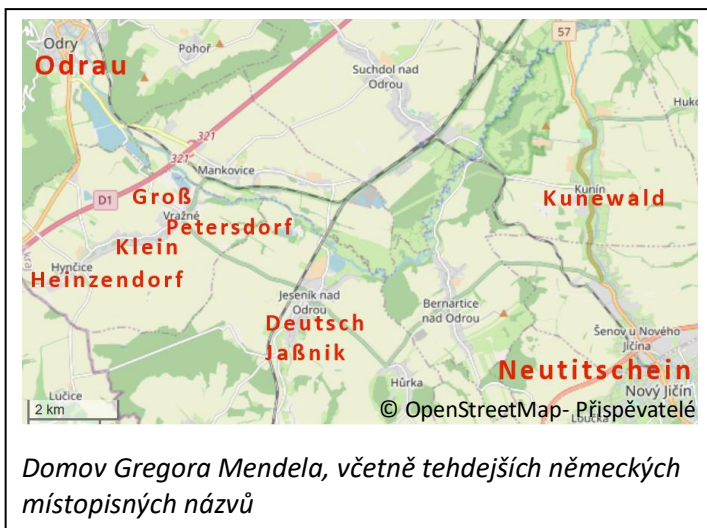
Domov Gregora Mendela, včetně tehdejších německých místopisných názvů

Jižně od městečka Odry leží podél silnice obce Hynčice ( nem. Heinzendorf ), Horní Vrážné ( nem. Klein Petersdorf ) a Dolní Vrážné ( nem. Groß Petersdorf ), které se řadí jedna za druhou podél Vráženského potoka ( nem. Roßbach ) před jeho vtokem do Odry. Obce Hynčice a Horní Vrážné, kdysi součást